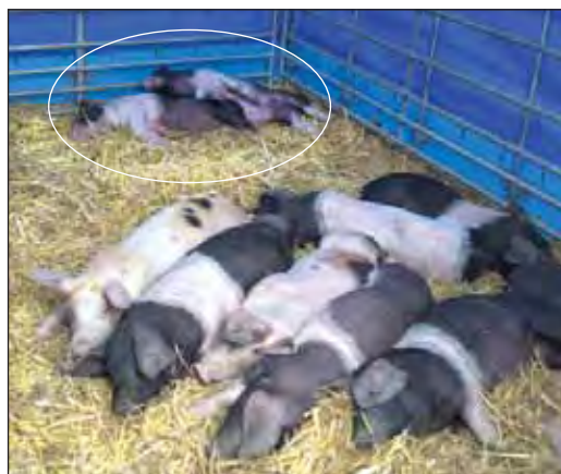
Selata českého plemene přeštické černostrakaté si to na dožínkách doslova užívala...

tači. Třeba si mohou vylézt na traktor, který často vidí jen z dálky na poli, nebo si mohou pohladit telátko, ovci a vidí další zvířata v akci. Když je tady ➔