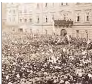
ŘÍJEN 1918 V HRADCI KRÁLOVÉ