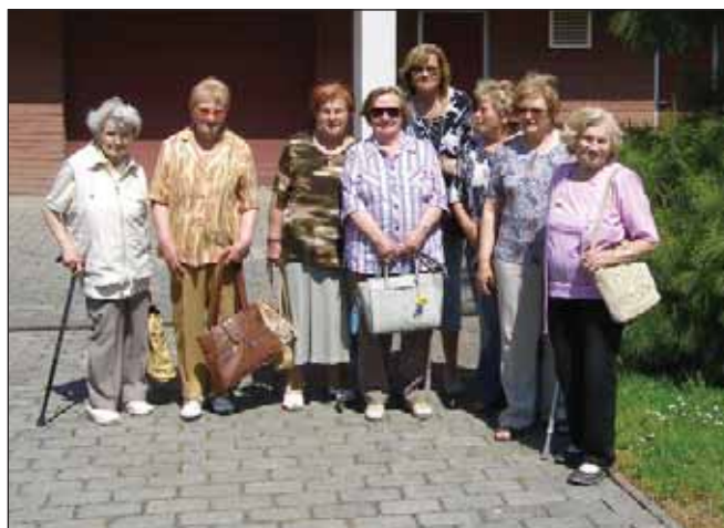
Levicový klub žen v Hradci Králové podniká také vycházky. Tato byla do Botanické zahrady farmaceutické fakulty.

Mým názorem je, že Úmluva od států vyžaduje především ochranu obětí domácího násilí! Cílem veškerých opatření má být zajištění potřeb a bezpečnosti obětí, vytvoření specializovaných podpůrných služeb, které budou obětem a jejich dětem poskytovat lékařskou pomoc a psychologické či právní poradenství. Důležité je také zajištění dostatečného množství dočasných útočišť a bezplatné nepřetržité telefonní linky důvěry.