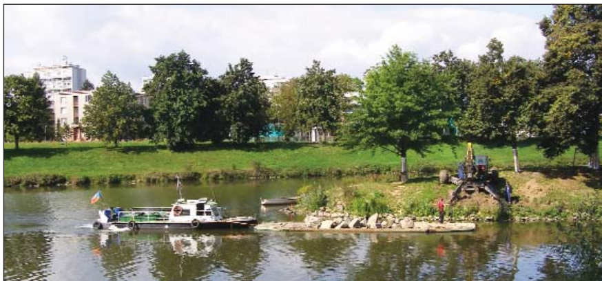
Oprava soutoku Labe s Orlicí v Hradci Králové za 11,6 mil. byla jednou z mála úspěšných investičních akcí města v letošním roce. Opravy zahrnovaly opevnění soutoku kameny a odstranění sedimentů z levého břehu Labe. K opravám sloužily lodě a prámy. Zbývá upravit park.