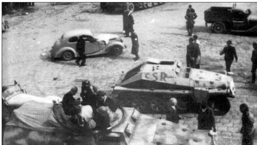
Hořice 5. 5. 1945