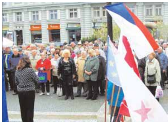
Letošní oslavy Svátku práce a pietní akty se musí obejít bez účasti veřejnosti.