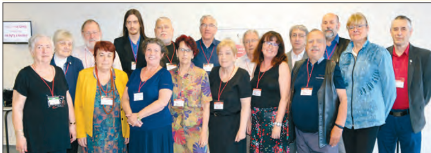
Skupina účastníků na sjezdu z našeho kraje.

Řádný XI. sjezd KSČM se konal v Brně na Výstavišti za přítomnosti 292 delegátů z celé ČR. Účastníci sjezdu projednali zásadní stranické materiály, které dostali předem. Schválili zprávu Ústředního výboru KSČM o činnosti od minulého sjezdu, zprávu o hospodaření a zprávy o činnosti revizní a rozhodčí komise a také Stanovy KSČM. Delegáti zvolili nové vedení a do čela opět Kateřinu Konečnou 88,8 procenty hlasů.