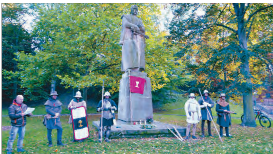
U sochy Jana Žižky v Hradci Králové se sešli 11. 10. členové ČSBS, LKŽ a další občané, aby si spolu se skupinou Tesák ze Všestaru připomněli den úmrtí velkého středověkého vojévůdce. Skupina předvedla husitskou zbroj, zbraně i způsoby boje.