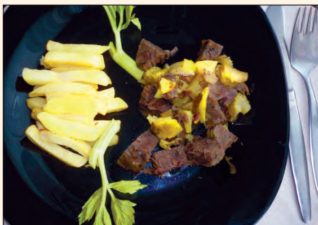
Jablečné dančí kostky

* Sous vide – potravinu (maso) vaříme zavakuované při nízkých teplotách více hodin. Může být marinované.