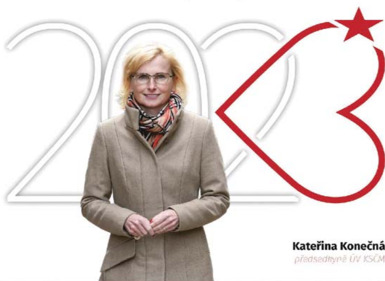
Kateřina Konečná předsedkyně ÚV KSČM

Měsíčník z Královéhradeckého kraje ▶ ročník 24 ▶ číslo 1 ▶ leden 2023 ▶ cena 5 Kč