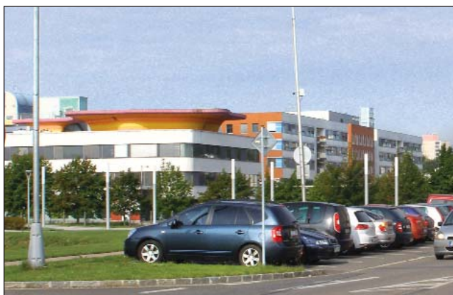
Heliport Fakultní nemocnice v Hradci Králové.