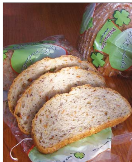
Speciální chléb z pekárny v Ličně.

Nemylme se, to není chybou Evropské unie. To je chybou našich polistopadových vlád. Kvůli nim panuje ve výrobních normách džungle, trh potravinami regulují obchodní řetězce a spotřebitel je šizen. Šizeni jsou však také naši zemědělci a potravináři. Kvůli chybám našich vlád mají mnohem horší podmínky pro hospodaření, nejsou schopni konkurovat cenou, a tak zaničují chovy hospodářských zvířat a dnes už v důsledku toho dovážíme více než 50 % vepřového masa a mnoho dalších