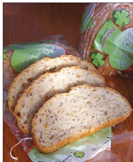
Speciální chléb z pekárny v Ličně.

Nemylme se, to není chybou Evropské unie. To je chybou našich polistopadových vlád. Kvůli nim panuje ve výrobních normách džungle, trh potravinami regulují obchodní řetězce a spotřebitel je šizen. Šizeni jsou však také naši zemědělci a potravináři. Kvůli chybám našich vlád mají mnohem horší podmínky pro hospodaření, nejsou schopni konkurovat cenou, a tak zaničují chovy hospodářských zvířat a dnes už v důsledku toho dovážíme více než 50 % vepřového masa a mnoho dalších