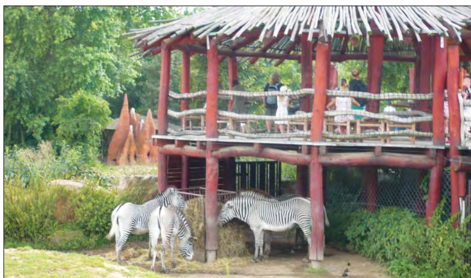
ZOO ve Dvoře Králové prožívá festival Africké léto – zebry v Safari parku to však neřeší...