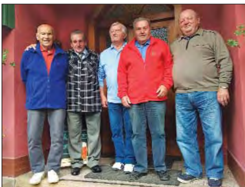
Pět kamarádů horníků po 60 letech...