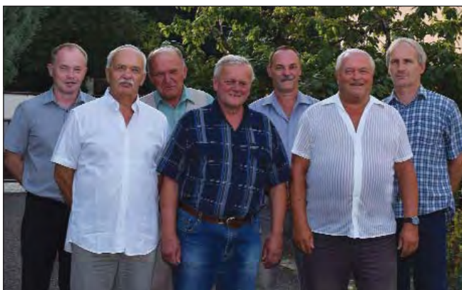
Jičínští kandidáti do zastupitelstva města.