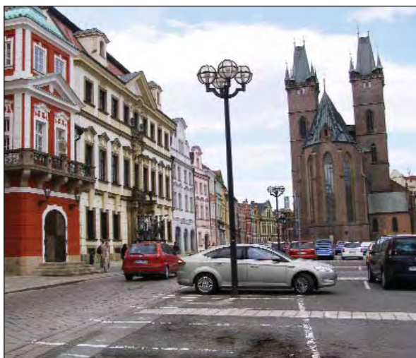
Dočká se Velké náměstí (dříve Žižkovo) v Hradci Králové své velké rekonstrukce?

Od května jsme využívali každou příležitost, abychom se zeptali hradeckých voličů, co by v našem městě chtěli změnit. Sešlo se nám přes padesát vyplněných anketních lístků, což sice není mnoho, ale stačí to na orientaci v přáních a potřebách voličů, které se staly základem volebního programu KSČM v Hradci Králové.