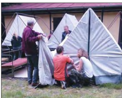
Stavba tábora Hvězdička ve Slatině.