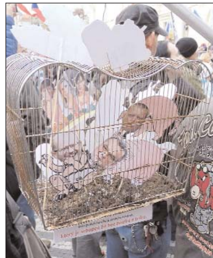
Foto z demonstrace na podporu prezidenta Zemana na Pražském hradě. J. Rejř

Velký důraz byl a je kladen na zlepšení údržby silnic a souvisejících objektů v majetku Královéhradeckého kraje, včetně údržby zeleně a porostů. Rovněž tak je úspěšná úzká spolupráce s Ředitelstvím silnic a dálnic, jako nedílnou součástí řešení silniční sítě v našem kraji. Spadají sem jak opravy silnic I. třídy, tak pokračování výstavby dálnice D11 a rychlostní silnice R35. V dopravě obslužnosti byl zdárně dokončen projekt Modernizace odbavovacího zařízení, který byl realizován ve dvou etapách a je přínosem nejen pro cestující veřejnou dopravou. Jak v oblasti dopravy, tak v oblasti kultury a památkové péče, kde jsem členem příslušného výboru, byl doposud odveden kus poctivé práce.