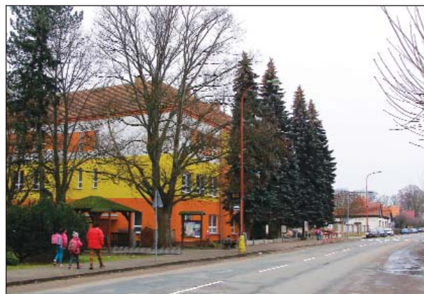
Skřivanská základní škola je pěkně opravená a čeká na nový semafor i na opravu školní družiny.

V obci žije skupina Romů, práce obecně mnoho není, takže nezaměstnaným pomáhají z obce alespoň organizováním