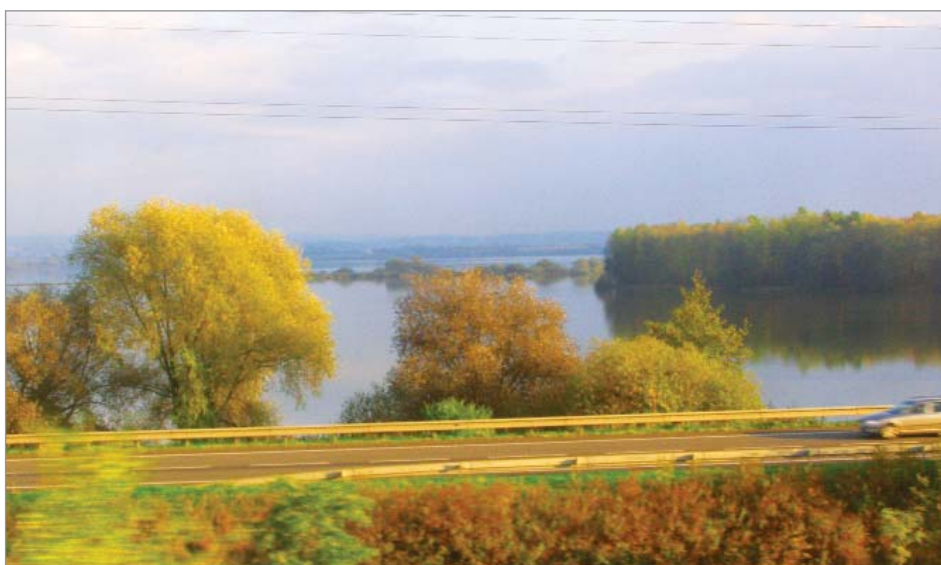
Největší vodní nádrž východních Čech, Rozkoš, je z jedné strany „zarámovaná“ jak silnicí, tak železnicí. Z jejího půvabu, zde na podzim, jí však ubírají i jiné problémy.